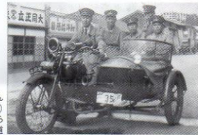
大正14年(1926年) 南麻布広尾交差点から 有栖川宮記念公園へ入る道

実際のプロジェクトの一部をお手伝いしていただきます。例：写真データ管理、アーティストの制作補助、会場受付、展覧会設営補助、写真&ビデオ撮影業務、事務。週に1日程度の活動のできる方。