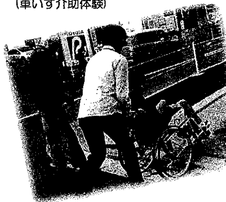
講座 (車いす介助体験)