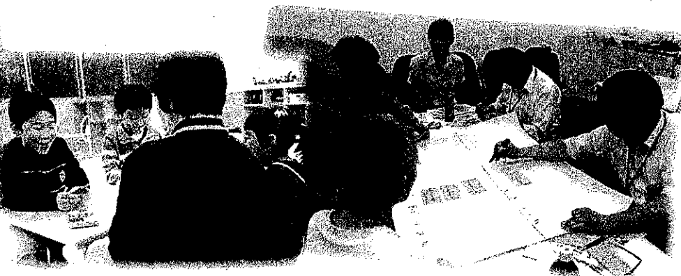
体験報告 (グループワーク)