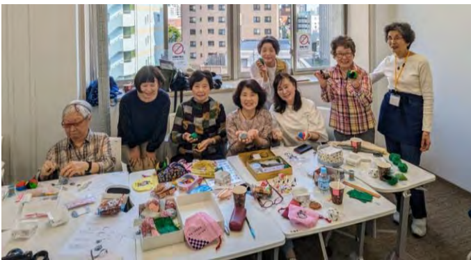
みんなでお手玉作り