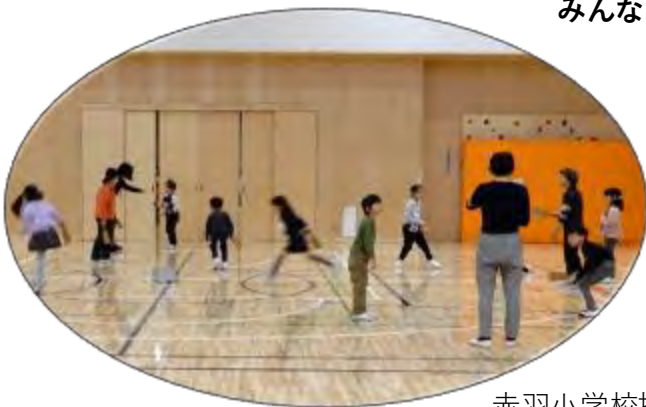
赤羽小学校授業で子供たちと