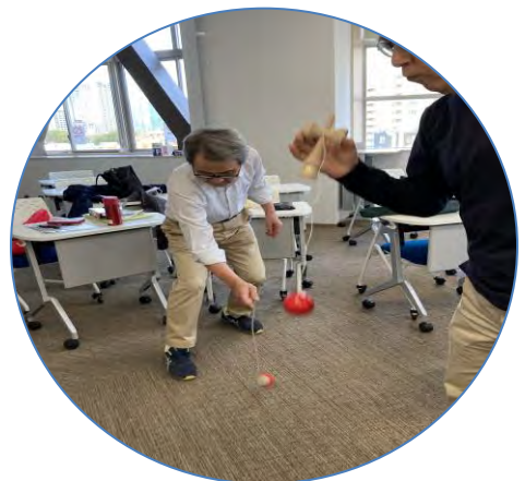
練習も楽しめます。