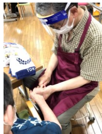
高齢者施設対 面ハンドケア 活動 (毎月)