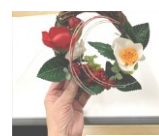
高齢者講座 手作づくりも 好評 (毎月)