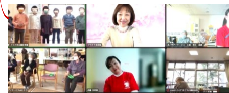
地域イベントと講座活動