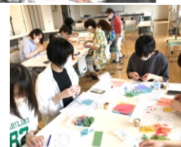
今年のカンパニーと地域 イベント 開催講座 (随時)