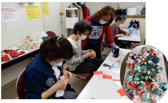
写真左： お手玉作り サロン 写真右 ゆかしの杜 での昔遊び