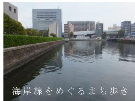
海岸線をめぐるまち歩き