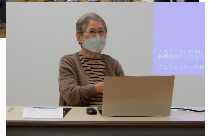
写真：左からゆかしの杜、区民センターのかんがり描き活動とかんがりハガキ、HUG 高輪ミニ講演会